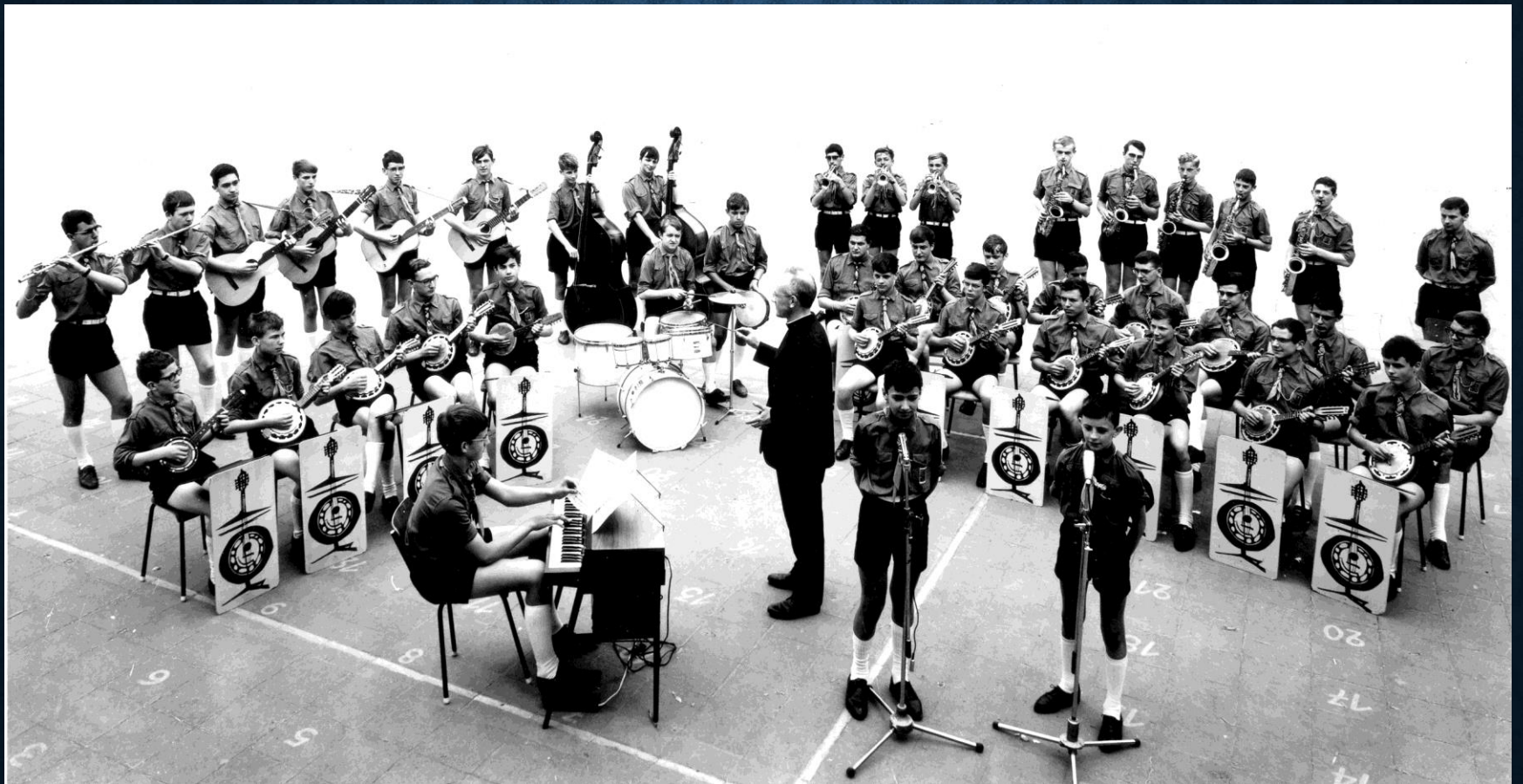
Groepsfoto uit 1966