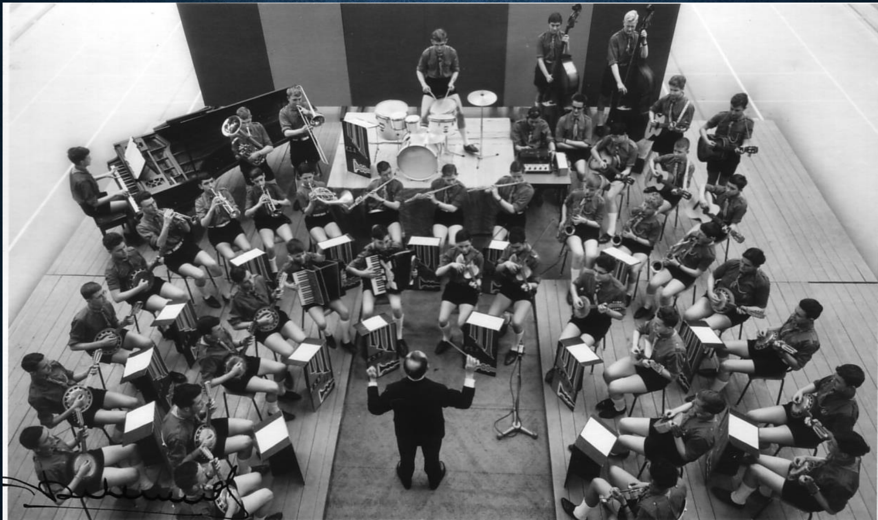
Groepsfoto uit 1963