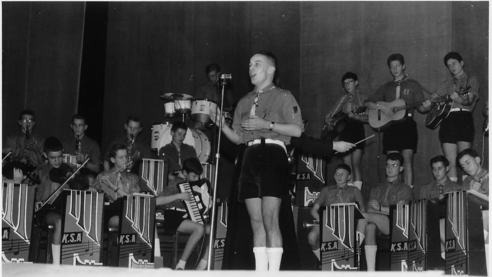
1961: OPTREDEN TIJDENS DE REIS