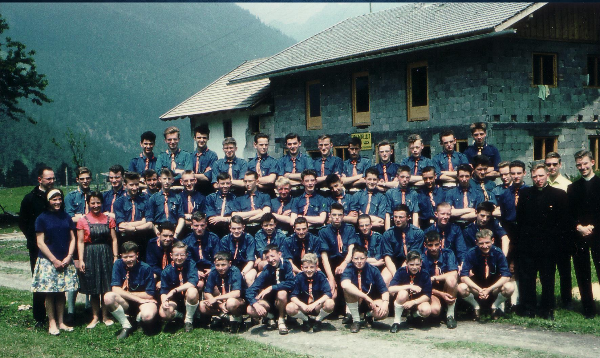
1961: eerste "lechtal"- reis